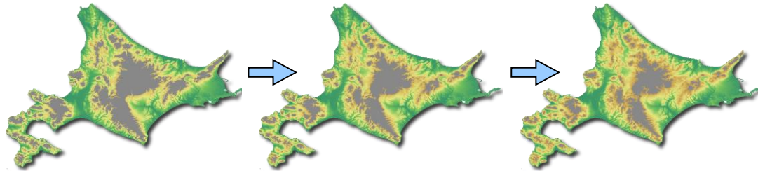
적설깊이 분포의 경년변화 추정