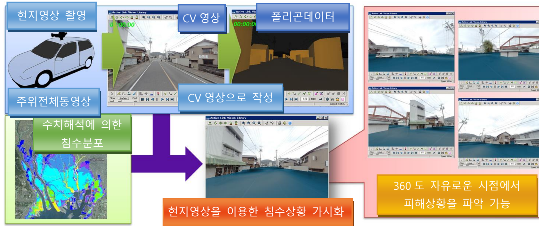
현지영상을 이용한 3 차원 재해리스크 가시화 기술의 개요